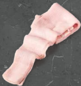
Słonina Back Fat