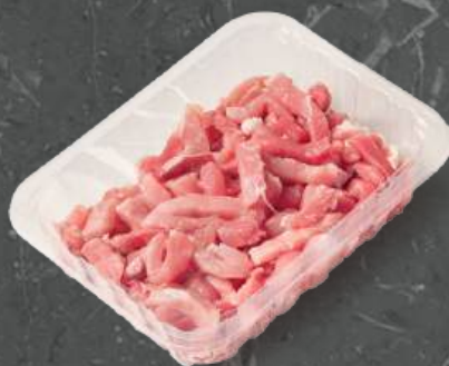
Paski z Szyunki Ham Stripes