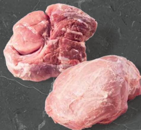
Szynka Kulka Knuckle