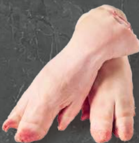
Nogi Przednie Front Feet