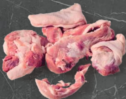
Trimming 50/50 Trimming 50/50