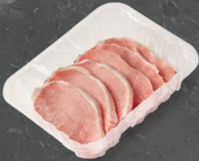
Schab w Plastrach Loin Chops