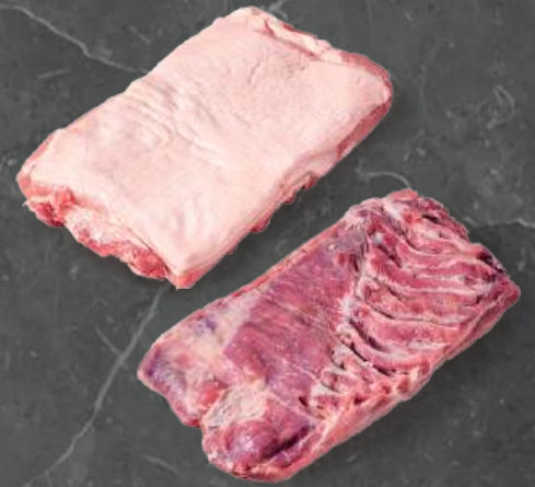
Boczek Łuskany Single Ribbed Belly