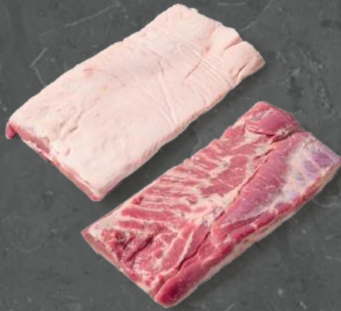
Boczek Białowany Sheet Ribbed Belly