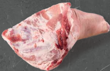
Łopátka z Kością Shoulder Bone In