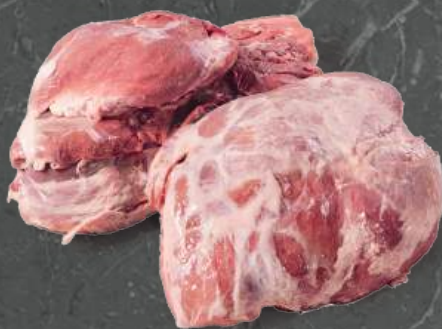
Szynka 4D Leg 4D