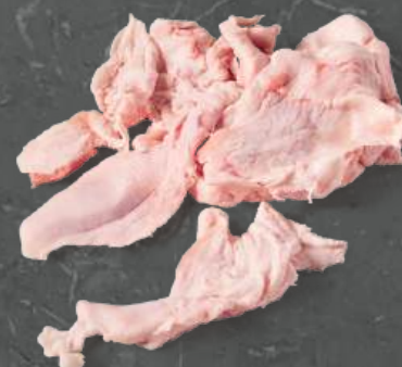
Tłuszcz Miękki Soft Fat