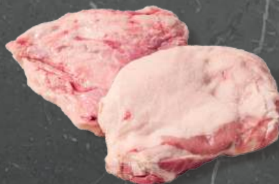
Podgardle bez Skóry Jowl Skin Off