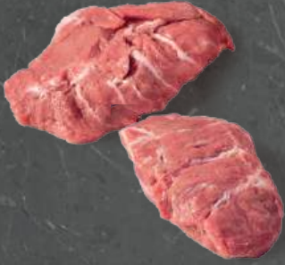
Policzki Wewnętrzne / Zewnętrzne Inner Cheeks / Outer Cheeks