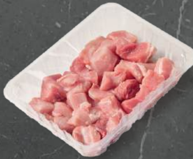
Gulasz z Szyneką Ham Goulash