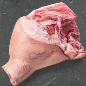
Szynka z Kością Leg Bone In