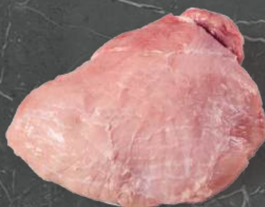
Zrazowa Górna Top Side