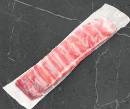
Żebro Belca Belca Ribs