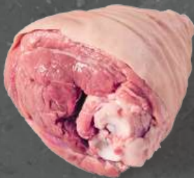
Golonka Tylna Hind Shank