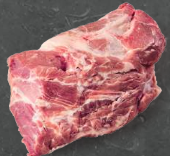
Karkówka 1323 Collar 1323