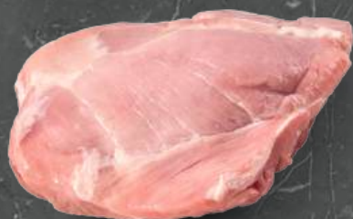
Trójgłowy Triceps Muscle