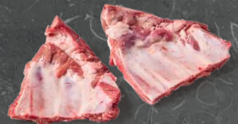
Żebra Trójkąty Riblets