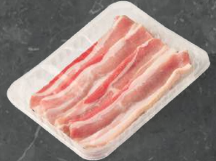
Boczek w Plastrach Belly Slices