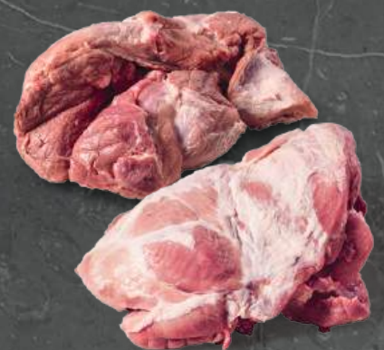
Łopátka 4D Shoulder 4D