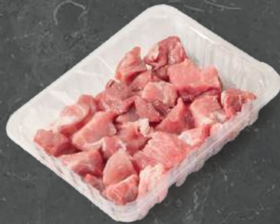
Gulasz z Łopatką Shoulder Goulash