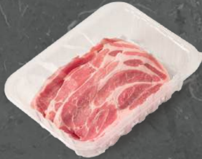
Karkówka w Plastrach Collar Chops