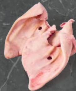
Uszy Klasa A Ears A Grade