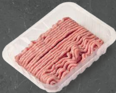
Mięso Mielone z Szyneką Leg Minced Meat