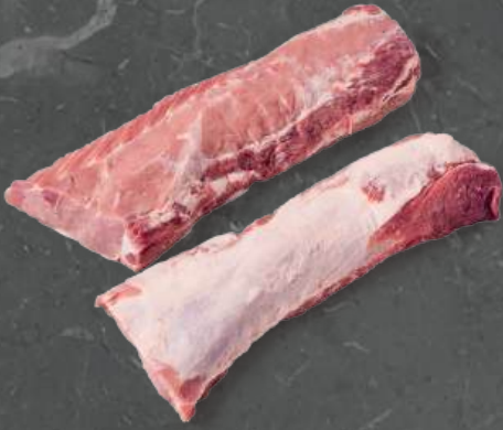
Schab z Warkoczem Loin Chain On