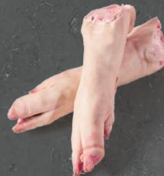
Nogi Tylne Hind Feet