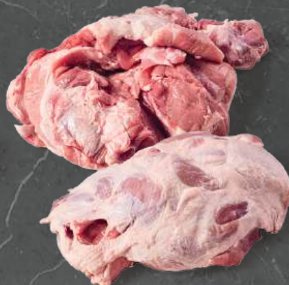
Łopátka 3D Shoulder 3D