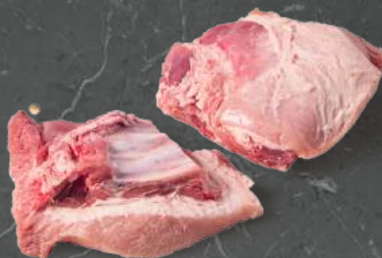
Żebra Trójkąty Mięsne Meaty Riblets