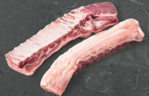
Żebra Paski Mięsne Meaty Ribs