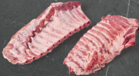
Żebra Płaty Spare Ribs