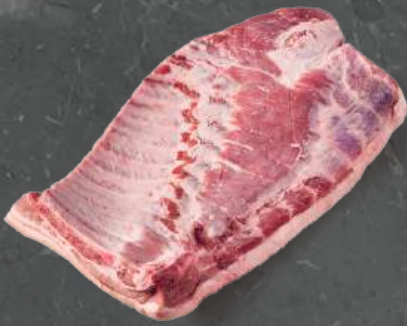
Ćwiartka Boczkowa Belly Bone In