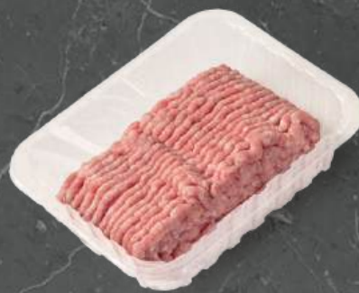
Mięso Mielone z Łopatką Shoulder Minced Meat