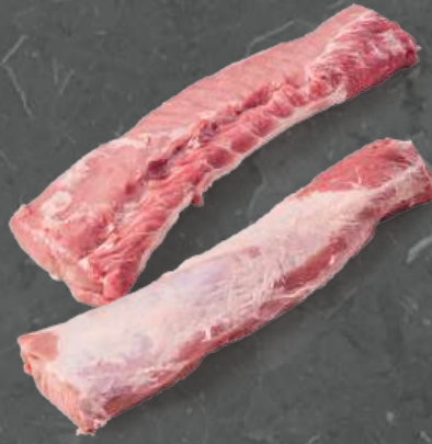
Schab bez Warkocza (Extra) Loin Chain Off (Extra)