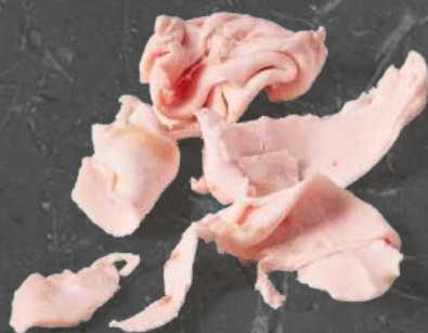
Tłuszcz Drobny Cutting Fat