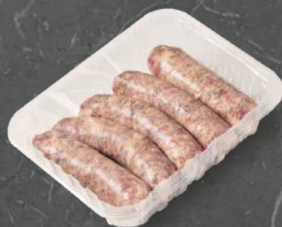
Biała Kiełbasa Raw White Sausage