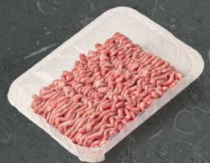
Mięso Garmazeryjne Minced Meat with Additives