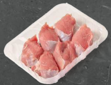
Medaliony z Połędwiczki Tenderloin Steaks