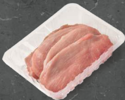
Sznyce z Szyunki Ham Schnitzels