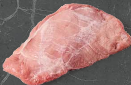
Zrazowa Dolna Silver Side