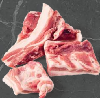
Trimming 70/30 Trimming 70/30