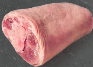
Golonka Przednia Front Shank