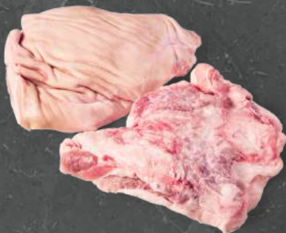
Podgardle ze Skórą Jowl Skin On