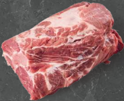
Karkówka 1320 Collar 1320