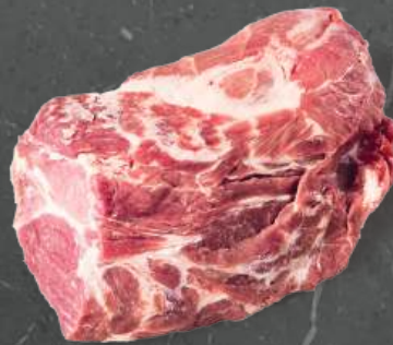
Karkówka 1321 Collar 1321