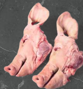
Połówki Głów Head Halves