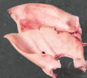
Uszy Klasa B Ears B Grade